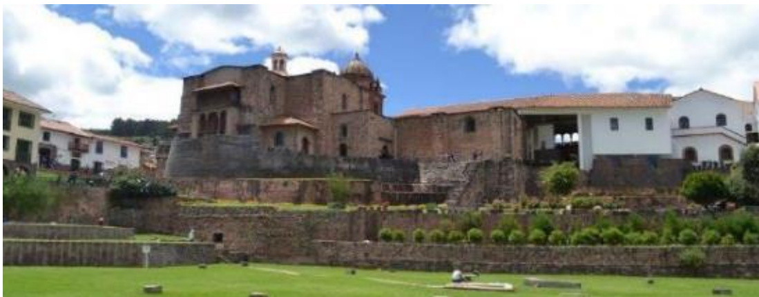
Chrám Slunce Qoricancha v Cusco.

Navštívíte chrám Qoricancha , původní incký zlatý Chrám Slunce , na jehož základech vystavěli Španělé klášter San Domingo. Zajdete se podívat do uličky Calle Hatunrumiyoc na dvanáctiúhelný incký kamen.