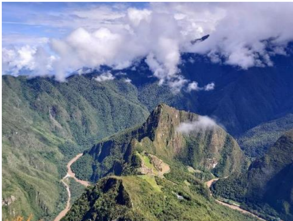
Pohled z hory Machu Picchu.

Na Machu Picchu strávíme skoro celý den. Nejdříve si vyšlápeme na horu Machu Picchu, abychom si vychutnali místo téměř bez turistů a pak si prohlédneme městečko (ruiny).