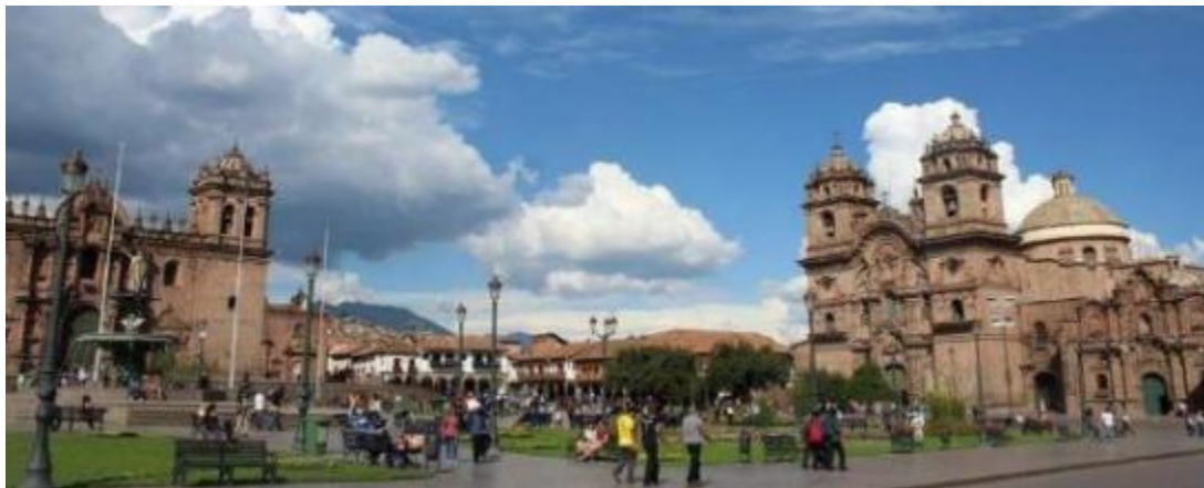
Náměstí Plaza de Armas v Cusco.

Odpočinkový den pro prohlídku města . Při prohlídce města se podíváte na náměstí Plaza de Armas , katedrálu La Cathedral či kostel Iglesia de Jesús, María y José .