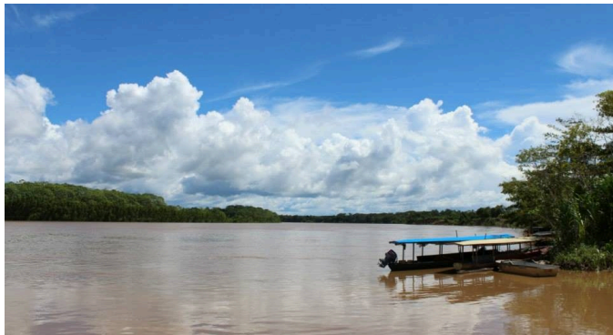
Přístav v Puertu Maldonadu – do rezervace Tambopata se jezdí těmito loděmi.

tarantule požírat šváby vylézající po setmění z děr a koutů. Sprcha byla vzhledem ke smradu, mému stavu a studené vodě celkem rychlá. Při sprchování na mě spadl ze stropu pouze jeden šváb.