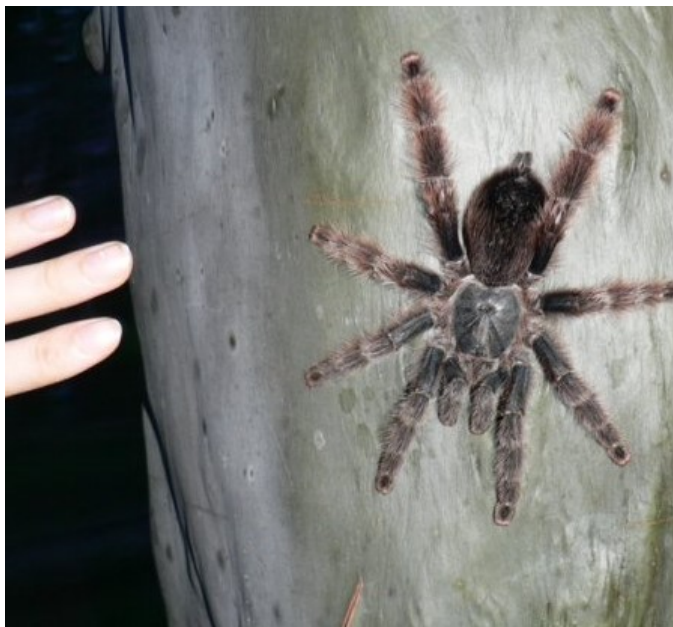
Stromový druh tarantule zvaný sklípkan huňatý (pink toed tarantula – pro růžové konce nožiček) na stromě vedle našeho bungalovu.

Na další blížká setkání měla tu čest Naty. Jednou po dopoledním návratu od jezera si dala sprchu. Když vylezla, automaticky sáhla po ručníku, který si přes sebe přehodila. Z něj jí na ruku vyskočila překvapená tarantule (asi zrovna spala, jsou to noční živočichové). Z koupelny se ozvalo spoustu španělských nadávek, a než jsem za Naty přišla zjistit, co se děje, tarantule zmizela dírou v podlaze. Nevím, která z nich se lekla více.