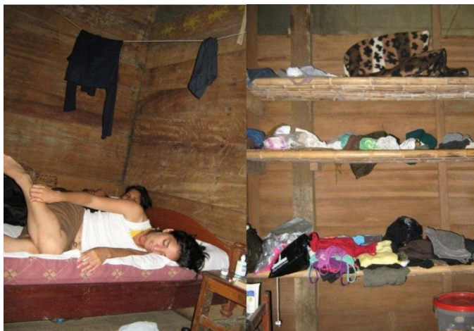
Takto vypadaly naše pokoje – postel, židle a pár poliček. Svítilo se pouze svíčkami. V horní části dřevěných zdí byly kvůli lepší cirkulaci vzduchu a světlu sítě. V období dešťů bylo třeba věci vzhledem k vysoké vzdušné vlhkosti pravidelně větrat, například batoh pod postelí se mi během pár týdnů celý obalil plísní.