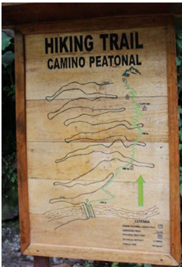
Cesta na Machu Picchu z Aguas Calientes autobusem (černě) a pěšky (zeleně)

1) pěšky – cesta nahoru trvá cca 1-2 hodiny (dle fyzické zdatnosti), cesta zpět dolů asi hodinu. Počátek cesty pro pěší je za mostem a vede po jiné trase než jezdí autobusy. U počátku cesty je z obou stran dřevěná mapa (viz foto) a cesta je značená.