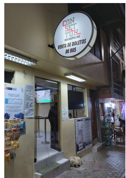
Prodejna autobusových jízdenek Consettur v Aguas Calientes